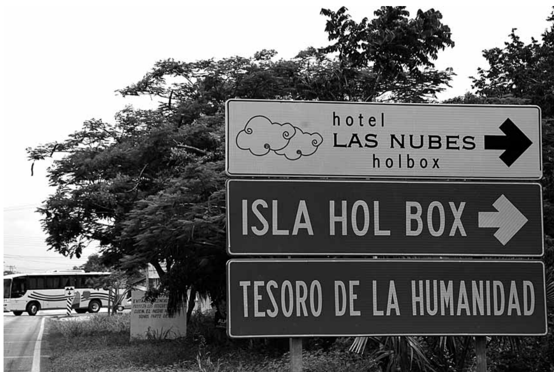
Figura 2. Anuncio publicitario reciente de la Isla Holbox. Recent sign advertising Isla Holbox.

El primero de los actores locales a tratar es la comunidad de Chiquilá, la cual es la puerta de entrada a la Isla Holbox y la comunidad con