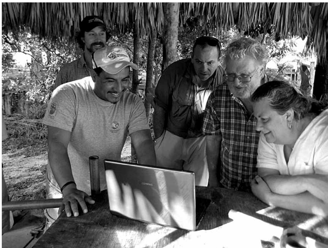
Figura 5. Foto de una cita con miembros de Puerta Verde y el PCE. Photo of a meeting between members of Puerta Verde and the PCE.

Puesto que buscamos fondos para apoyar esta tarea, existen pasos iniciales que podemos comenzar a realizar. Uno es darnos el tiempo para reunirnos con los representantes de todos los grupos actores del área (Figura 5). A medida que iniciamos un trabajo arqueológico más intensivo en la costa norte, debemos priorizar estas relaciones para encontrar qué es lo que ellos esperan obtener de nuestro estudio, limitar los malos entendidos acerca de nuestros objetivos de investigación y contemplar las necesidades de estos actores como una manera de ayudarnos a planear futuros proyectos. Otro paso a seguir es el desarrollo de una página web bilingüe (español e inglés) del PCE que incluya toda nuestra información de contacto, antecedentes acerca del proyecto de investigación y acceso a nuestros textos y reportes. Involucrar al sector educacional es otro camino que nos gustaría recorrer. Puede ser que lo anterior no abarque al total de los actores de manera colectiva pero cada caso puede tratarse individualmente para integrar a los grupos interesados.