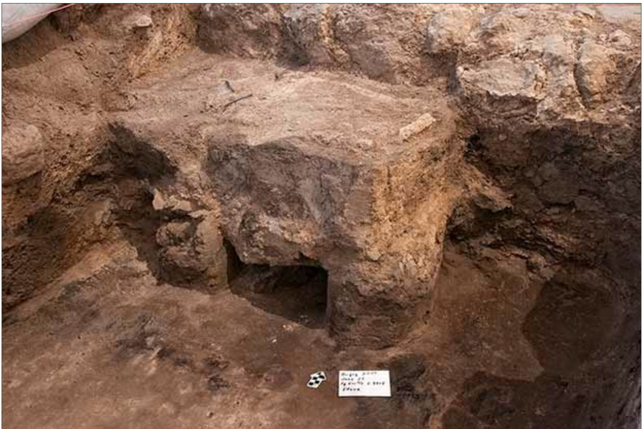
10. שטח 3000, תנור במבנה מהמאה ה'ל'סה"ג, מבט לצפון-מערב.