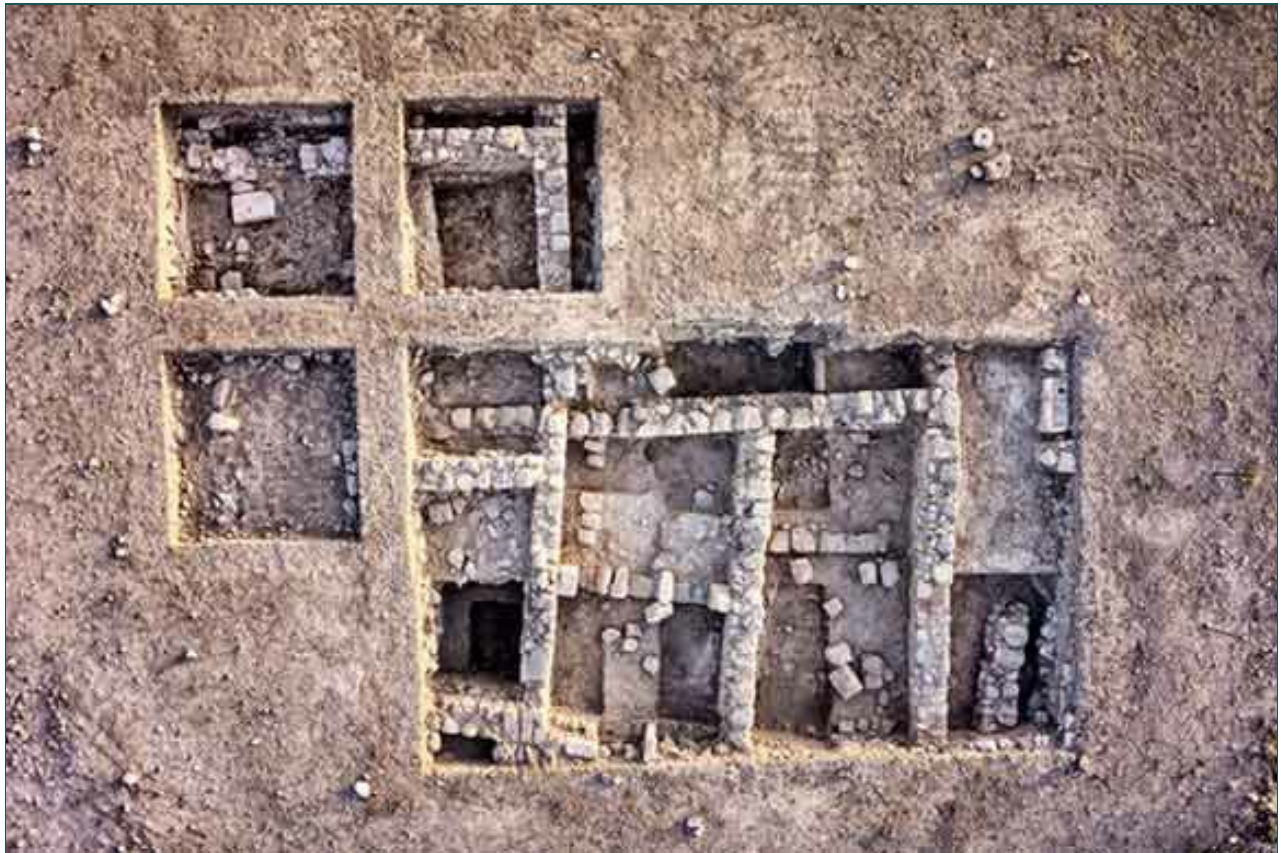
1. שטח 2000, תצלום אוויר לצפון.