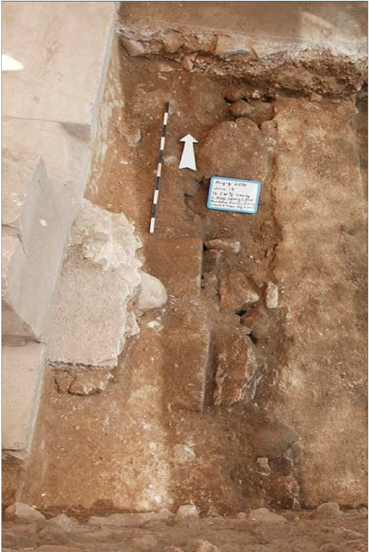
8. שטח 3000, מפולת תקרת בית הכנסת שנחתכה בתעלת היסוד של הסטילובט מימי הביניים, מבט לצפון.