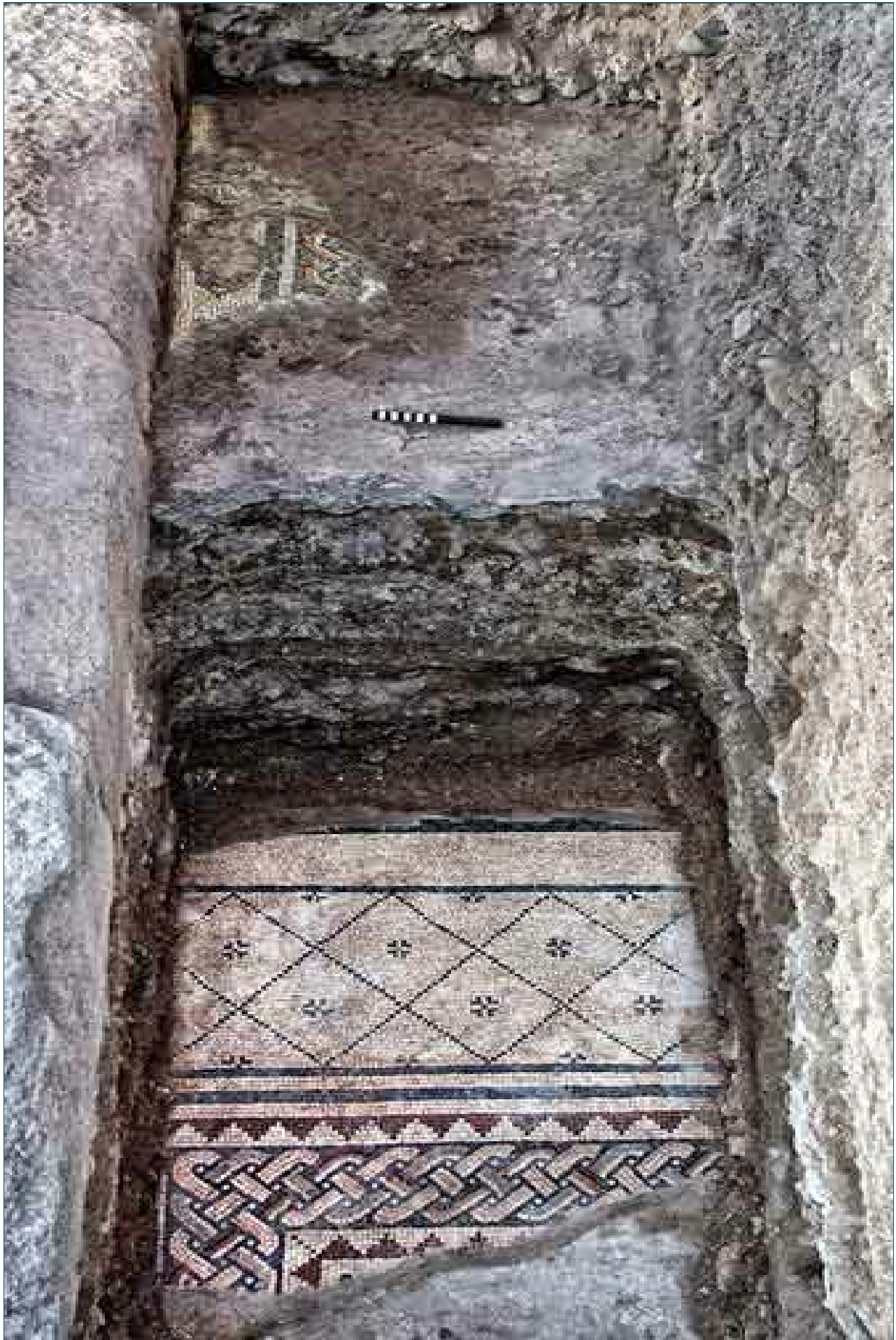
5. שטח 3000, קטע מרצפת פסיפס בסטרה המזרחית בבית הכנסת מהתקופה הרומית המאוחרת (למטה) וקטע מרצפת פסיפס מימי הביניים (למעלה), מבט לדרום.