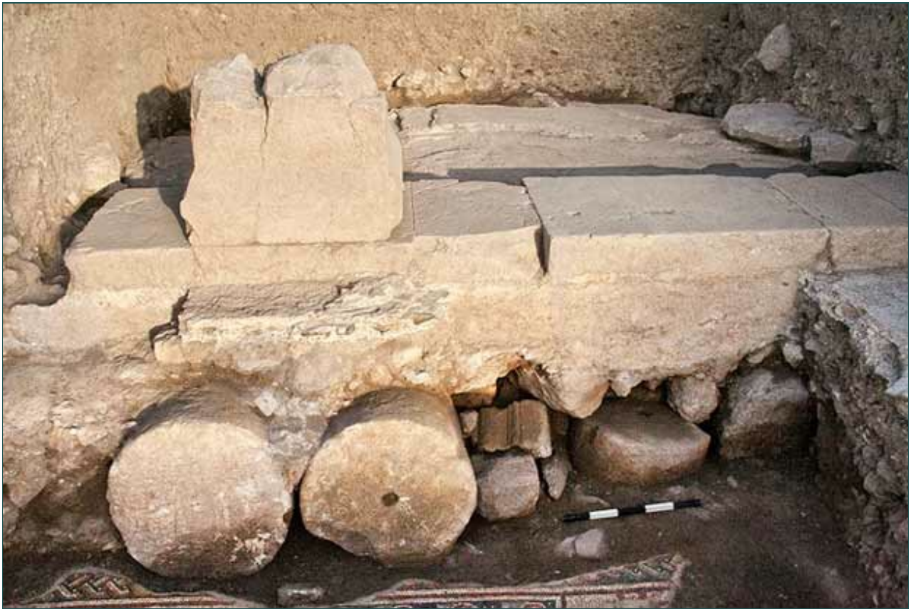
9. שטח 3000, הסטילובט ומעליו פדסטל במבנה הציבור מימי הביניים, מבט למערב.