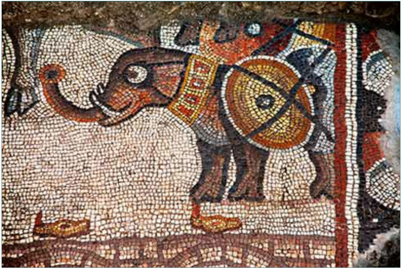
7. שטח 3000, פיל מלחמה ברצפת הפסיפס בבית הכנסת, מבט למערב.