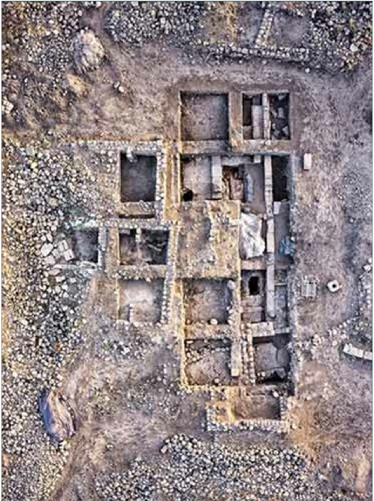
3. שטח 3000, תצלום אוויר לצפון.