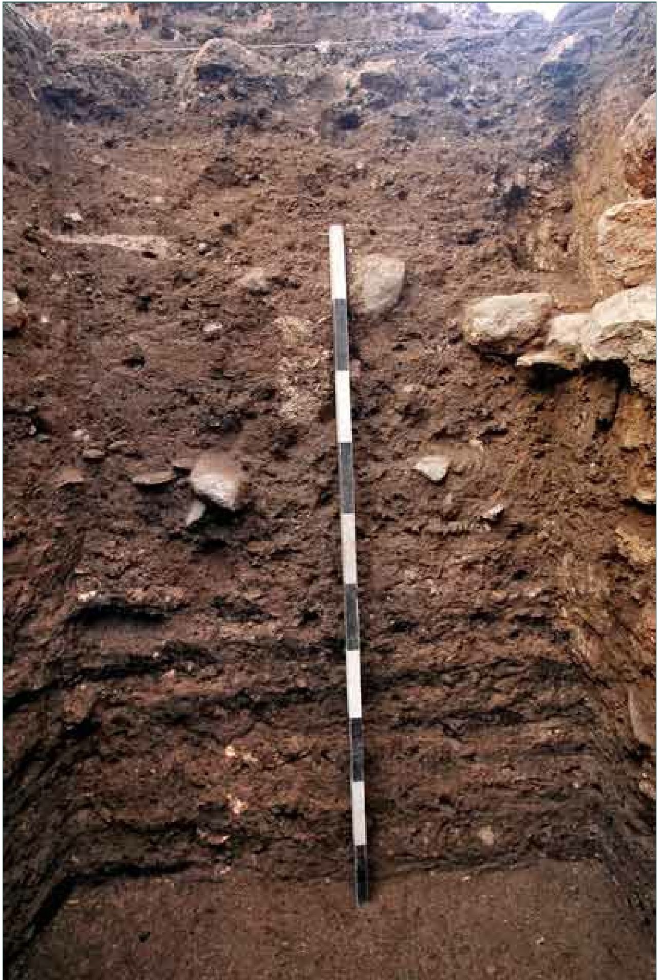
4. שטח 3000, חתר בדיקה מתחת לרצפת פסיפס, מבט לצפון.